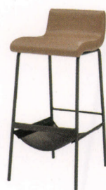
SC-ルッカ(ブラウン) 張地 / レザー