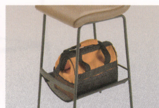
荷物置き付(着脱式)