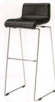
SC-テック(C) 張地 / B5-36