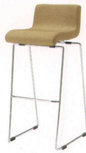
SC-テック(B) 張地 / B25-02