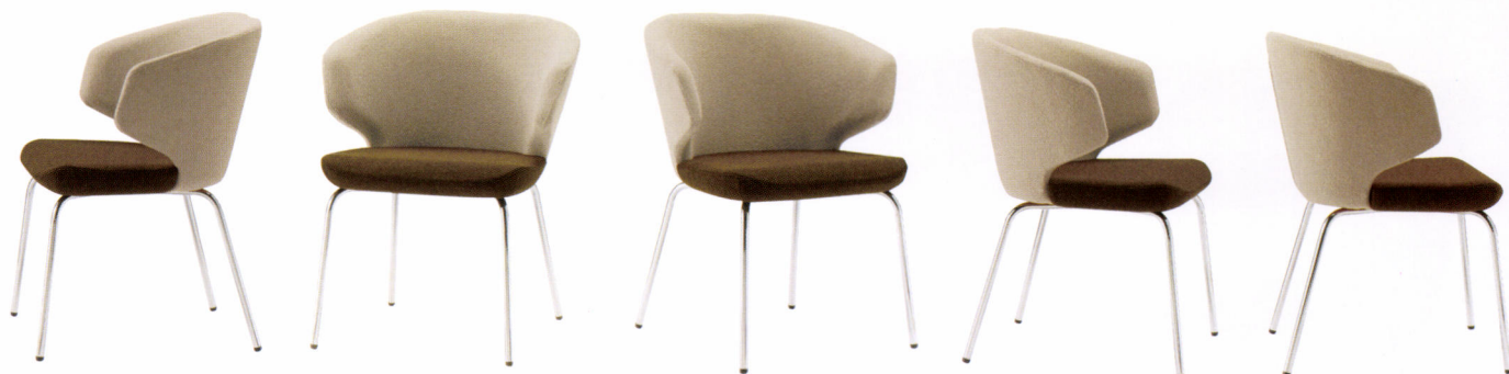
KC-ショール(I) 張地/背・ニット(E62-02) 座・ニット(E62-06) (コンビネーション張)