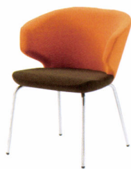
KC-ショール(I) (コンビネーション張)