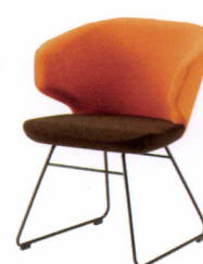
KC-ショール(II) (コンビネーション張)