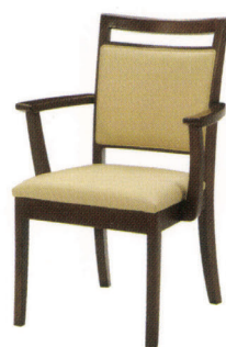
DC-シンシア JWL 張地 / C44-05