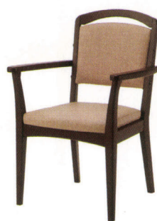
FC-サティ JWL 張地 / E43-03