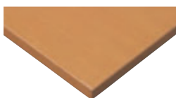
指紋レスメラミン化粧板