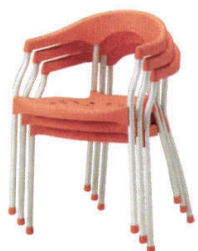
スタッキング(床積6脚)