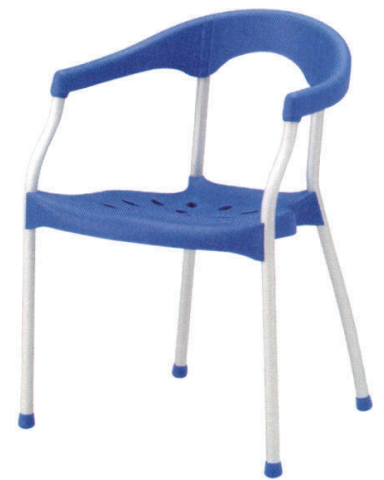
KC-ラップ BL ¥17,000