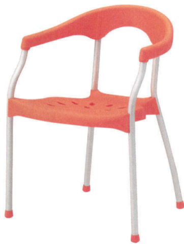
KC-ラップ AP ¥17,000