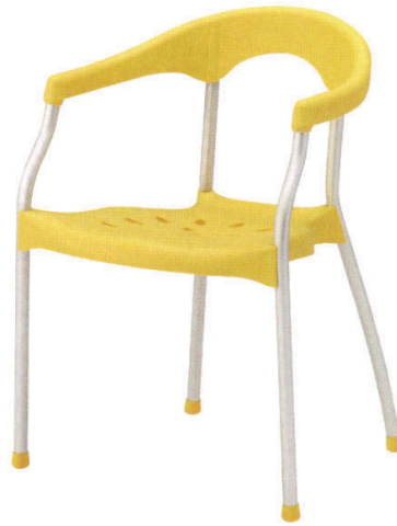
KC-ラップ YE ¥17,000