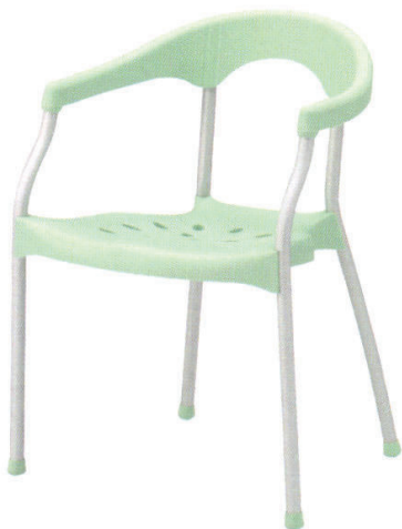
KC-ラップ GE ¥17,000