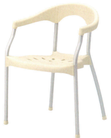
KC-ラップ WH ¥17,000