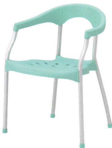
KC-ラップ AQ ¥17,000